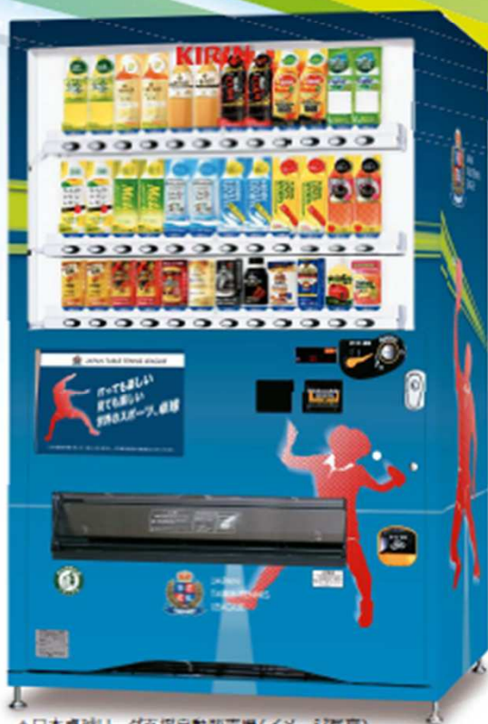
▲日本卓球リーグ支援自動販売機(イメージ写真)