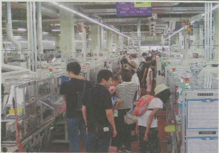
工場を見学する来場者＝いずれも湖西市梅田で