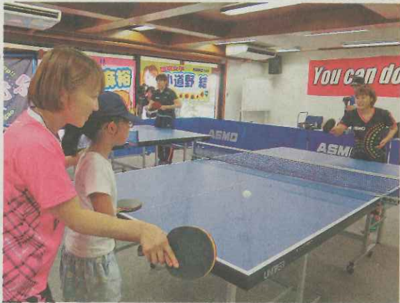
アスモ女子卓球部の選手から指導を受ける参加者