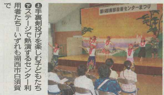
手裏剣投げを楽しむ子どもたち ステージで熱演するセンター利用者たち＝いずれも湖西市白須賀で