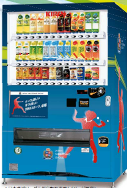
▲日本卓球リーグ支援自動販売機(イメージ写真)